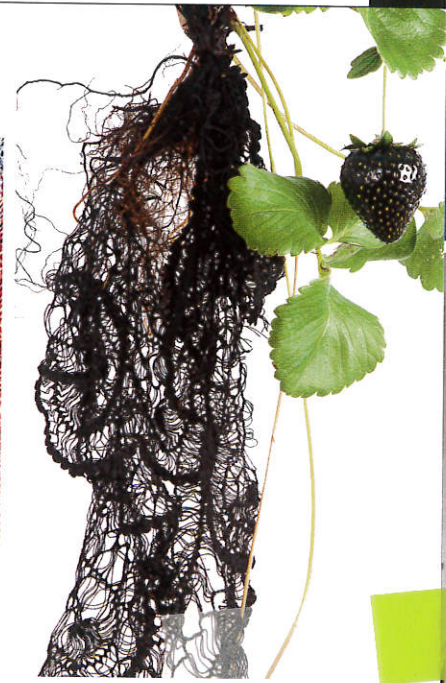
Black Strawberry Lace by Carole Collet

das Bescheidene, Reine und Schmucklose in den Mittelpunkt gestellt. Dabei wird auf Materialien und Oberflächen gesetzt, die einen dezenten, aber unverkennbaren Luxus ausstrahlen. Der Wunsch nach Entschleunigung und nach einer Beschäftigung mit dem Handwerk hingegen führt zu einer Tendenz die „Rejuvenate Craft!“ genannt wurde; als Kontrapunkt zu einer von Technologie beherrschten Gesellschaft arbei-