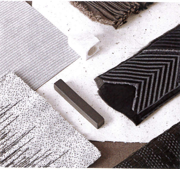
Craftica by Formafantasma for Fendi