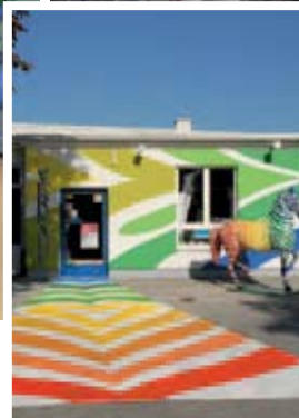
Mit Farben aus der Oberwaltersdorfer Farbenproduktion werden jährlich ca. 15 Millionen Quadratmeter beschichtet!